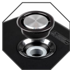
Клапан выпуска пара